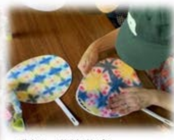
講師：遊染夢舎あそむしゃ