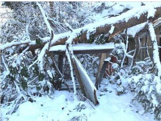
竪穴住居(室町時代)向かいのアカマツの倒木