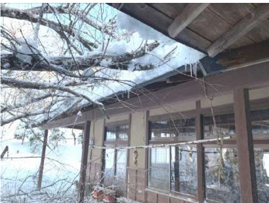
茶屋前のナラの倒木