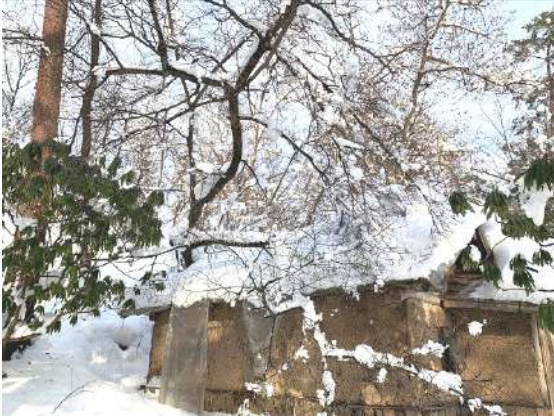
竪穴住居(室町時代)裏の倒木したサクラ

の箇所は通行止めとし、翌日から通常営業することができました。年が明け、立マ込んでいるスツジニールを調整してもらい新年7日に撤去していただきました。園路に張り出している枝なども多いため、園内を歩く際は足元だけでなく、樹上からの落雪もご注意ください。