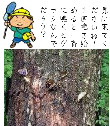
オオムラサキは採らないでね〜!