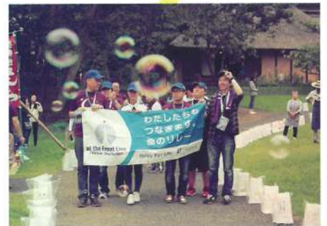
※リレーウォークに参加される場合は、別途申込が必要です。参加費 一人700円(レミナリエ代込み)。がん患者・経験者の方は無料です。

がん患者は24時間がんと闘っています。仲間や有志がリレーしながら24時間歩くことで、絶え間ないサポートをしていくことをみんなで再確認します。また、トークイベントやライブなどで当日の会場を盛り上げます。