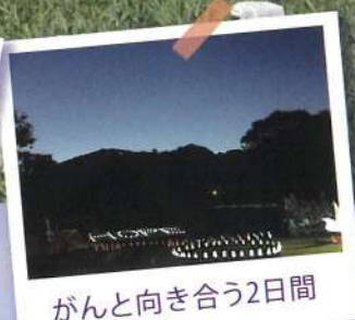
がん向き合う2日間

会場 みちのく民俗村 TEL 0197-72-5067 岩手県北上市立花14-62-3