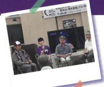
※昨年のチャリティ活動の様子

がん患者さんやそのご家族を支援し、地域全体でがんと向き合い、「住みよい地域社会」を目指して、1年を通じて取り組むチャリティ活動です。発祥はアメリカですが、国内でも全国に約50の団体が年間を通じてチャリティ活動を行っています。集められた寄付金は、公益財団法人日本対がん協会を通じ、がん研究者への助成、奨学金、がん相談などのがん患者支援に役立てられます。