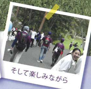
そして楽しみながら